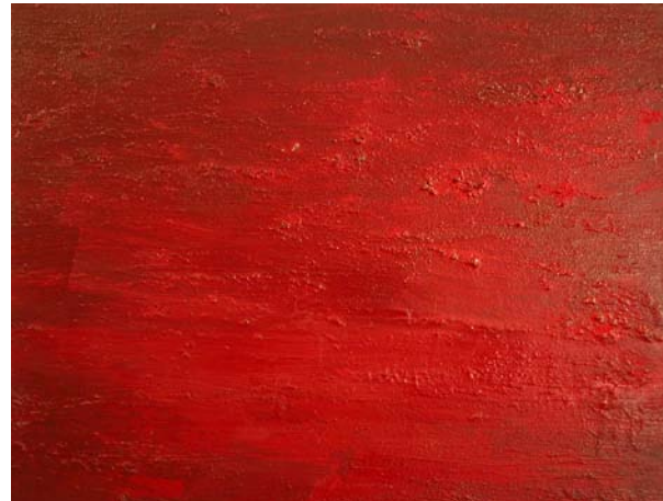
bordeaux intensiv1, 2002