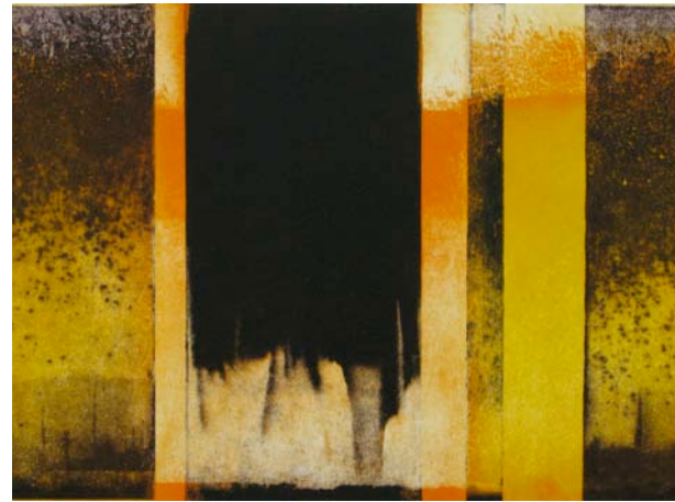
After Glow 1