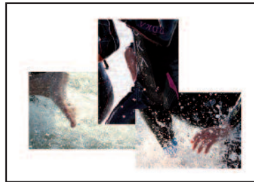
Lara Mouvée (Fotografien)