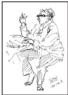
Birgit Breuninger Susanne Kuehnhold (Zeichnungen) (Fotografien)

Rathaus Wiesbaden | Schlossplatz 6 | 65183 Wiesbaden