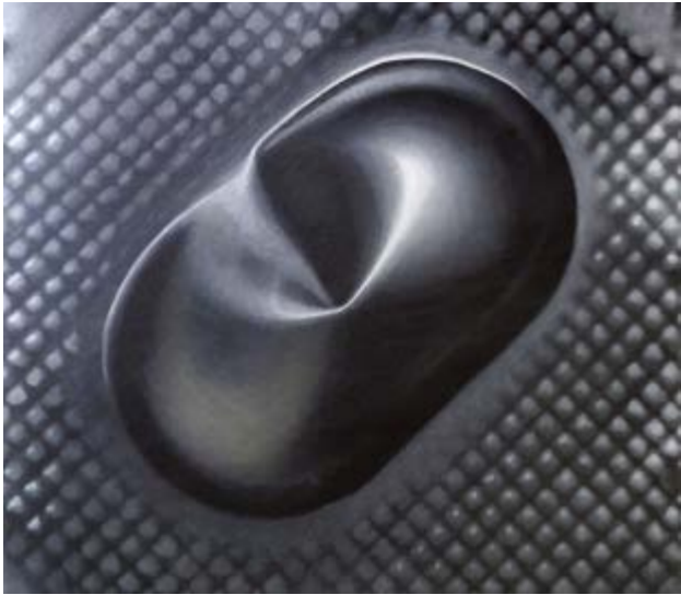
Elisabeth Schlanstein, Blister 1

Umgang mit dem Placebo selbstverständlich, doch machte einst der amerikanische Arzt Henry Beecher aus der Not eine Tugend, als ihm im Zweiten Weltkrieg das Morphin für die Behandlung verwundeter Soldaten ausging. Daraufhin versorgte er einfach einige Patienten mit Kochsalzlösung. Erstaunlicherweise wurde deren Schmerz trotzdem gelindert. Das vermeintliche Nichts löst also eine Menge aus, das veranschaulichen die teilnehmenden Akteure dieser Ausstellung auf eindrucksvolle und originelle Weise.