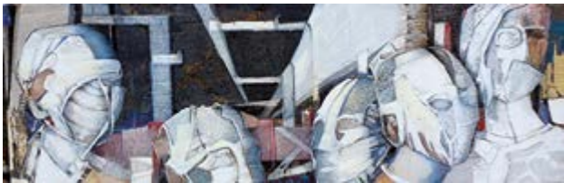
Ursula Faber, Die Probanden

Umgang mit dem Placebo selbstverständlich, doch machte einst der amerikanische Arzt Henry Beecher aus der Not eine Tugend, als ihm im Zweiten Weltkrieg das Morphin für die Behandlung verwundeter Soldaten ausging. Daraufhin versorgte er einfach einige Patienten mit Kochsalzlösung. Erstaunlicherweise wurde deren Schmerz trotzdem gelindert. Das vermeintliche Nichts löst also eine Menge aus, das veranschaulichen die teilnehmenden Akteure dieser Ausstellung auf eindrucksvolle und originelle Weise.