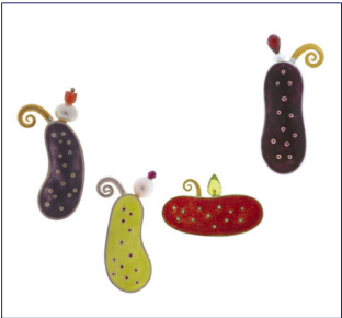
Elke Hackner - Schmuckbiotop