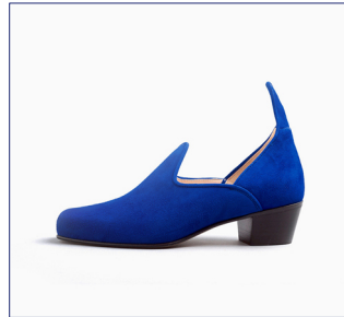
Bernd Dreßen - Artschock