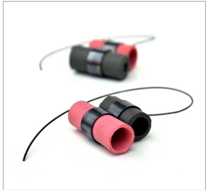
Elementaris by Beate Pfefferkorn